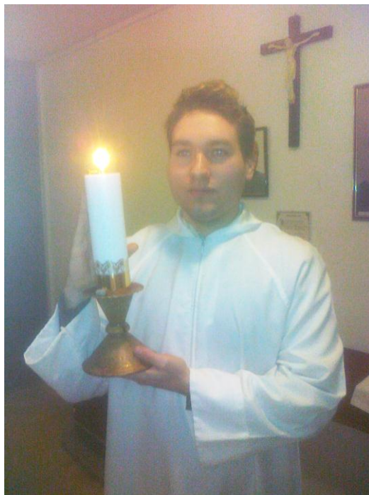
Így kell szépen gyertyázni ☺